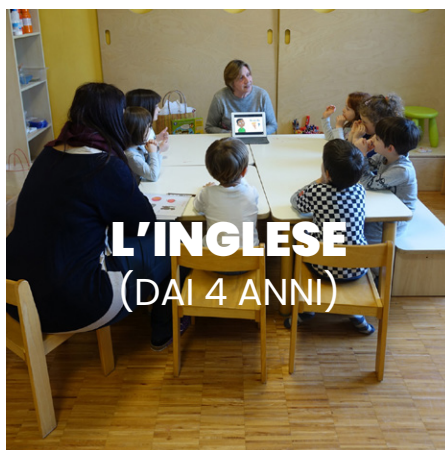
L'INGLESE (DAI 4 ANNI)